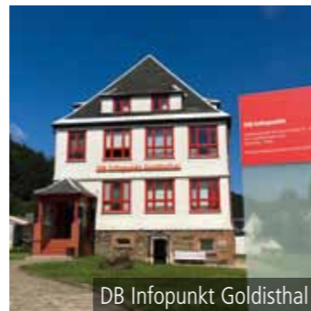
DB Infopunkt Goldisthal