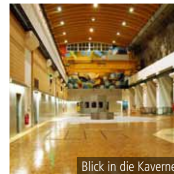
Blick in die Kaverne